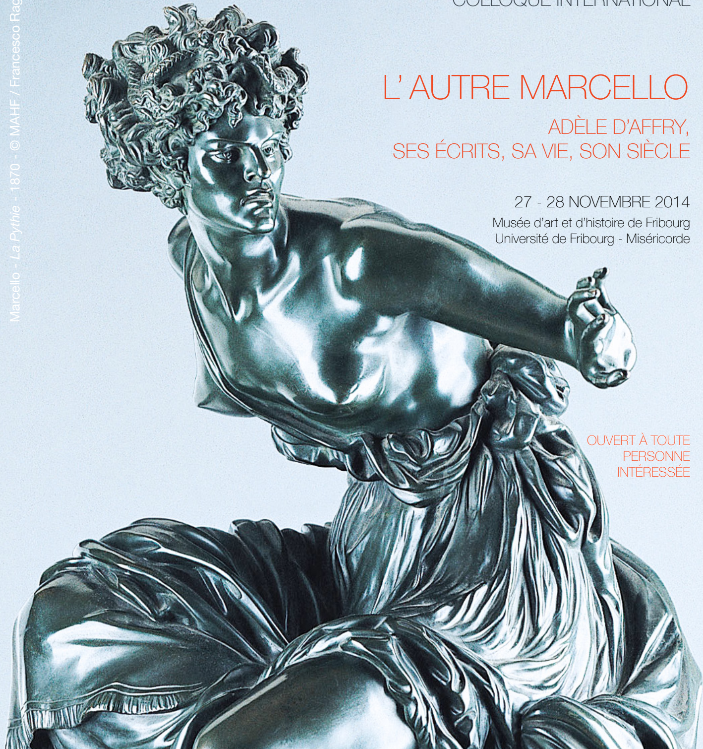
Marcello - La Pythie - 1870