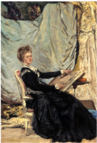
G. Clairin - Marcello dans son atelier - 1871

L'objectif premier de ce colloque, le premier jamais organisé sur les écrits de la sculptrice et peintre fribourgeoise Adèle d'Affry (1836-1879) plus connue sous le pseudonyme de « Marcello », est de faire connaître cette figure marquante des arts plastiques sous un angle différent, en mettant en lumière la richesse et l'originalité de sa personnalité créatrice, telle qu'elle